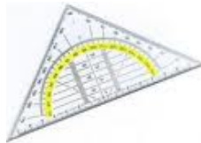
RULER (set square)